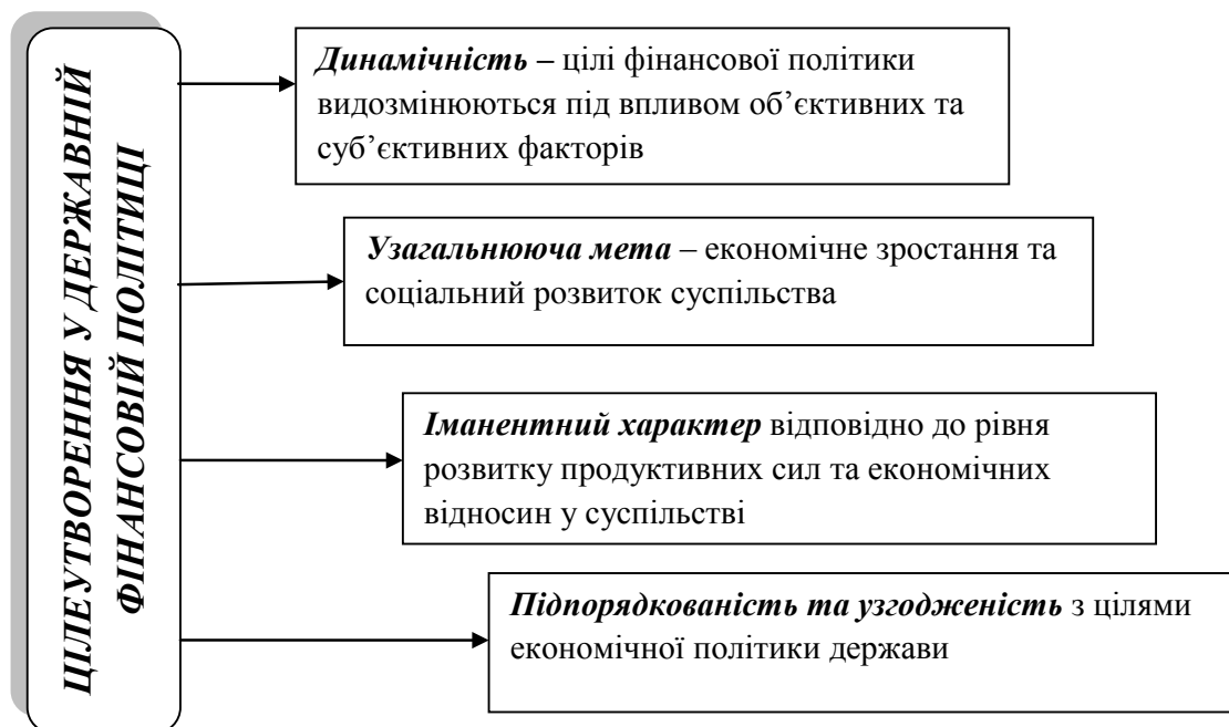
Рис. 1.1. Засади встановлення цілей у фінансовій політиці держави

Науковці, які обґрунтовують необхідність виділення фіскальної політики, наводять цілком прийнятні аргументи, все ж, на наш погляд, більш точним та коректним є окремий аналіз бюджетної та податкової політики як складових фінансової політики держави. На наш погляд, таку позицію можна пояснити тим фактом, що кожна наука, в тому числі фінансова, має відповідний категоріальний апарат, в якому об'єктивно існує пер-