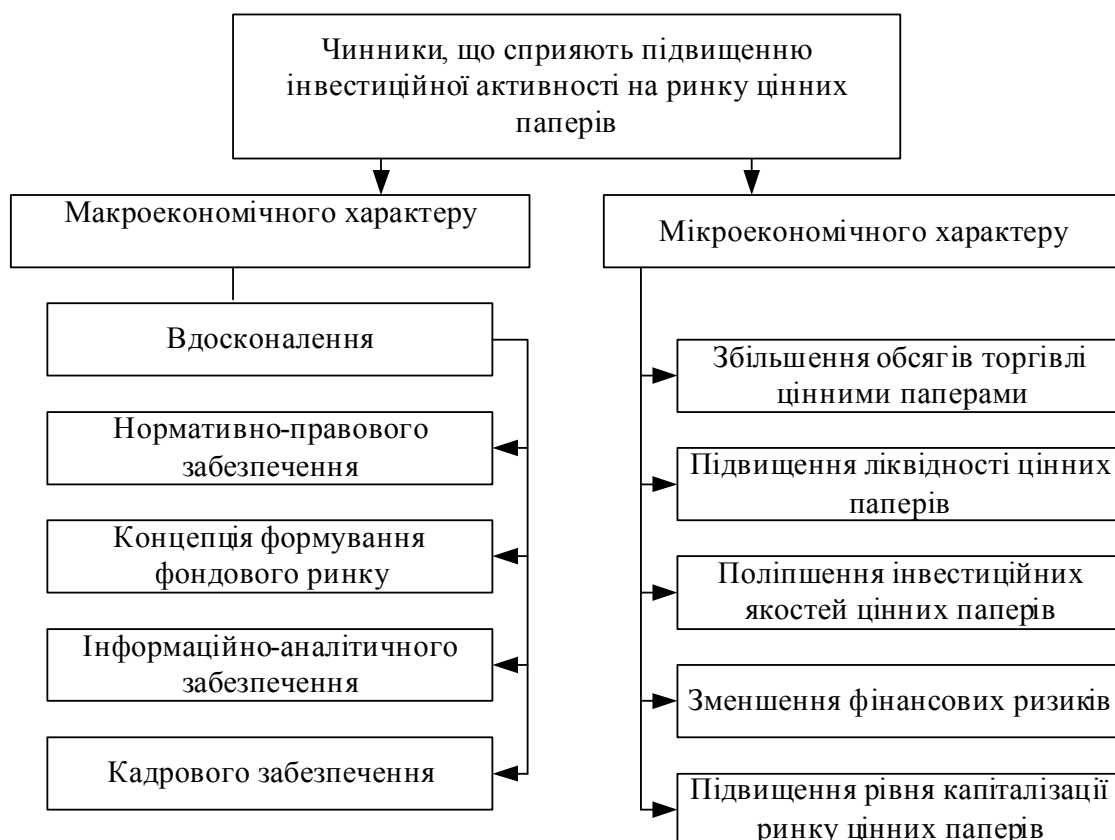
Рис. 1. Структура основних чинників активізації інвестиційної діяльності на ринку цінних паперів

До кризи одним із потужних напрямів зростання ВВП був приплив