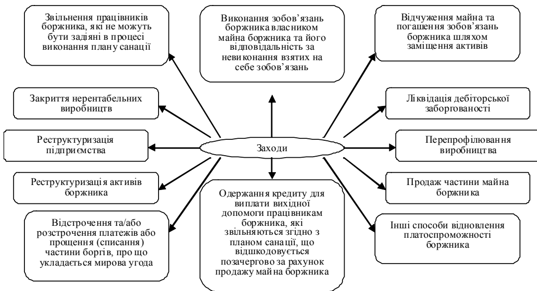
Рис. 3. Заходи щодо відновлення платоспроможності боржника, які містить план санації