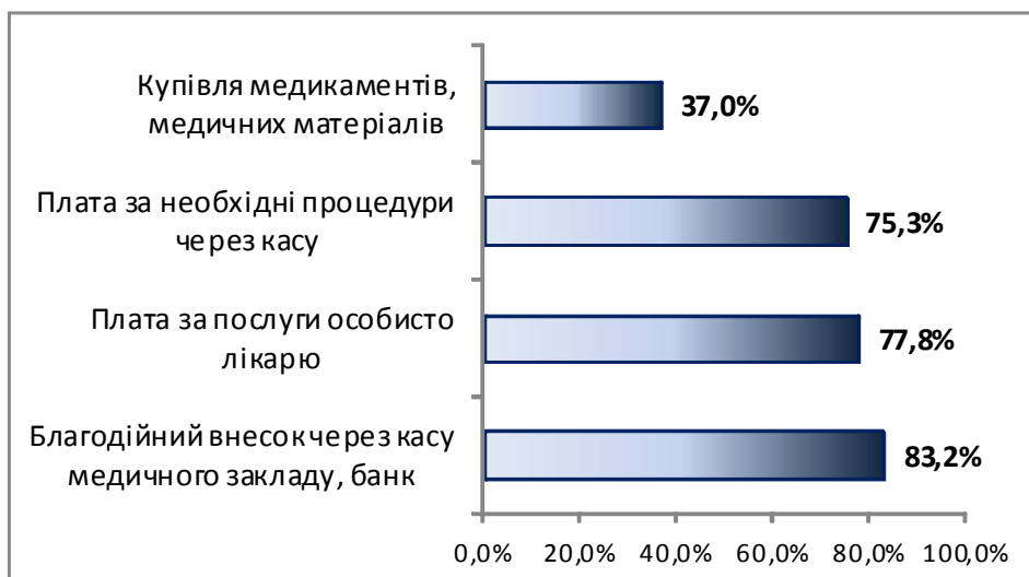
Рис. 2. Витрати пацієнтів при отриманні послуг з охорони здоров'я

Складність процесу переходу на страхову медицину визнають і представники державної влади. Так, перший заступник глави Адміністрації Президента України Ірина Акімова на III Міжнародній конференції «Хто допоможе медицині одужати: пошук рецептів» 4 листопада 2011 р. наголосила: «Страхова медицина річ абсолютно необхідна, але потрібна «домашня робота», якою ми зараз займаємося. У діряве відро хоч би скільки грошей лий, все одно вони витікатимуть. До того моменту, доки не буде реструктуризована мережа, доки правильно не розведені первинна медицина, вторинна, третинна, вводити страхову медицину в Україні небезпечно, тому що можна дискредитувати саму цю дуже добру ідею».