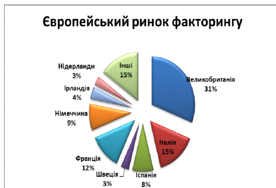
Рис.2. Європейський ринок факторингу.