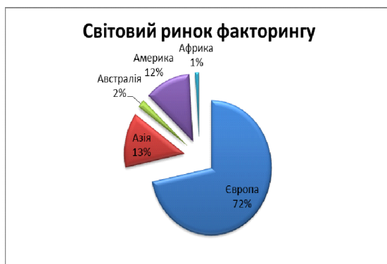
Рис.1. Світовий ринок факторингу.

Відносини, що виникають при укладанні факторингових угод в Україні регулюються Цивільним Кодексом України (глава 73). Визначення факторингу також дає Закон України «Про банки і банківську діяльність», Закон України «Про фінансові послуги і державне регулювання ринків фінансових послуг» та Податковий кодекс України. Ці закони України, прийняті у різний час, дають неоднозначне тлумачення щодо сутності поняття «факторинг» і хто саме може надавати факторингові послуги. Зазначені законодавчі і нормативні документи неузгоджені між собою, а відповідне регулювання суперечливе. Вказана неузгодженість не сприяє розвитку факторингових операцій в Україні. Кількість гравців - фінансових установ в Україні всього біля 80, з них 47 банків і більше 30 компаній. Але щодо фінансових компаній можна відзначити, що реально пропонують і надають клієнтам відповідні послуги - 5-7 компаній, останні на «індивідуальних» умовах, іншими словами: тільки декларують.