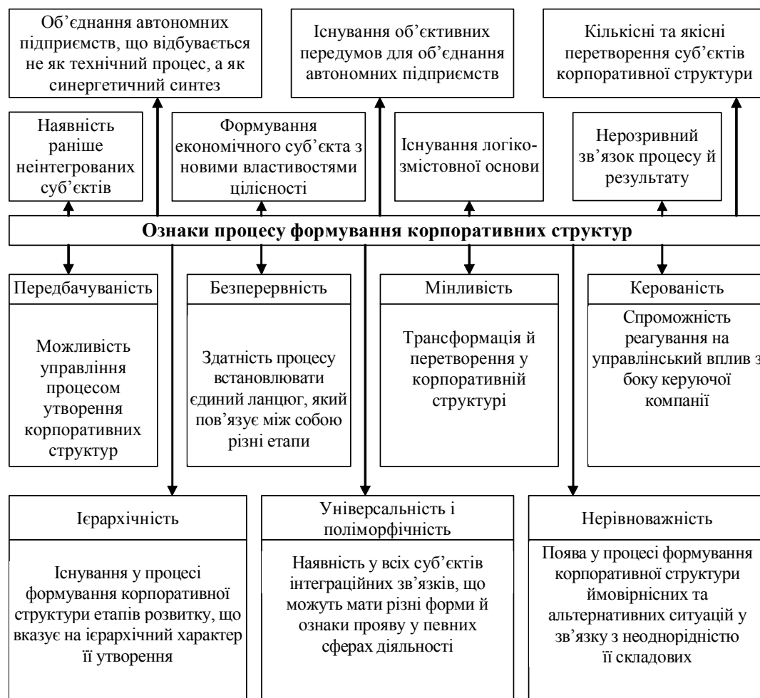
Рис. 2. Сутнісні характеристики процесу утворення корпоративних структур